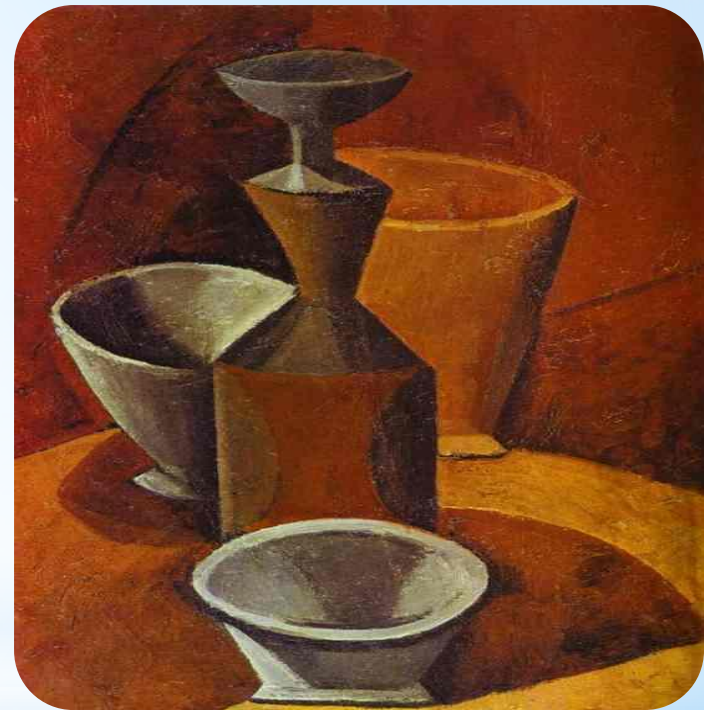
Бідон і миски