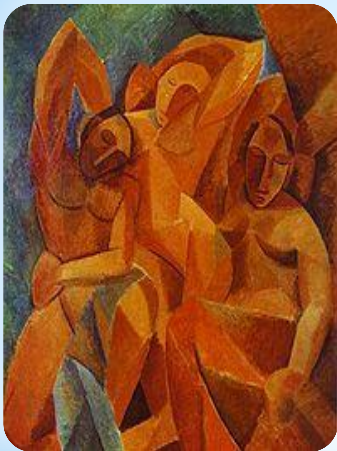
Три жінки (1908р.)

Правда, назву новій течії придумав журналіст Анрі Матісс, який зауважив, що картини Пікассо наповнені кубиками