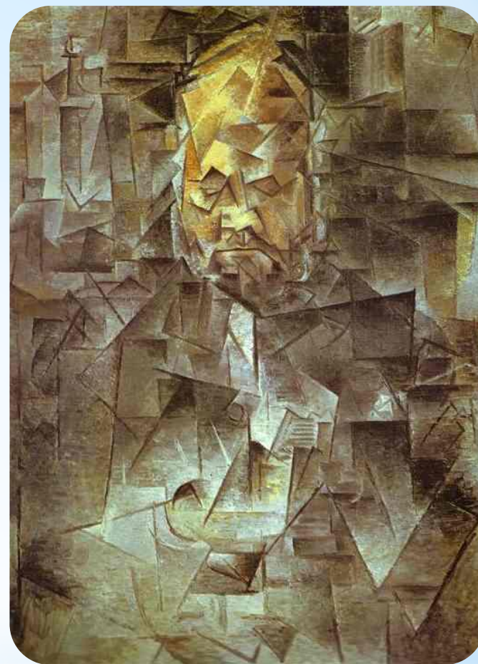
Портрет Амбруаза Воллара (1910р.)

Правда, назву новій течії придумав журналіст Анрі Матісс, який зауважив, що картини Пікассо наповнені кубиками