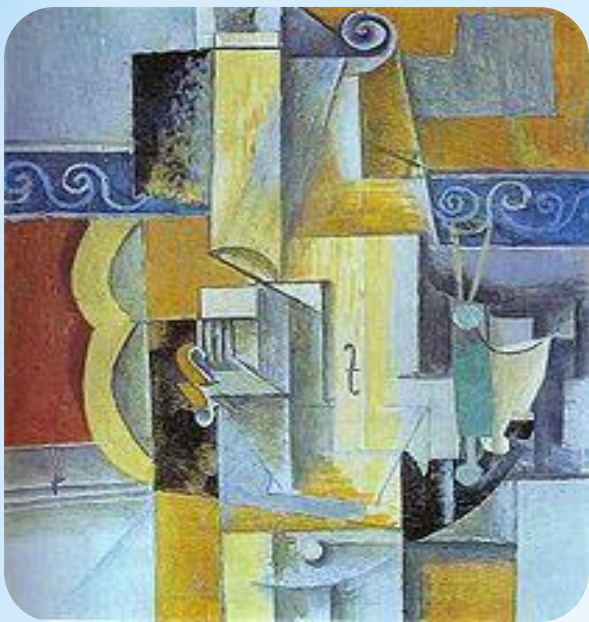
Завод в Хорта де Сан Хуан

Період кубізму в творчості Пікассо охоплює доволі значний проміжок від 1907 до 1917 року.